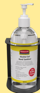
SUPPORTO A PARETE