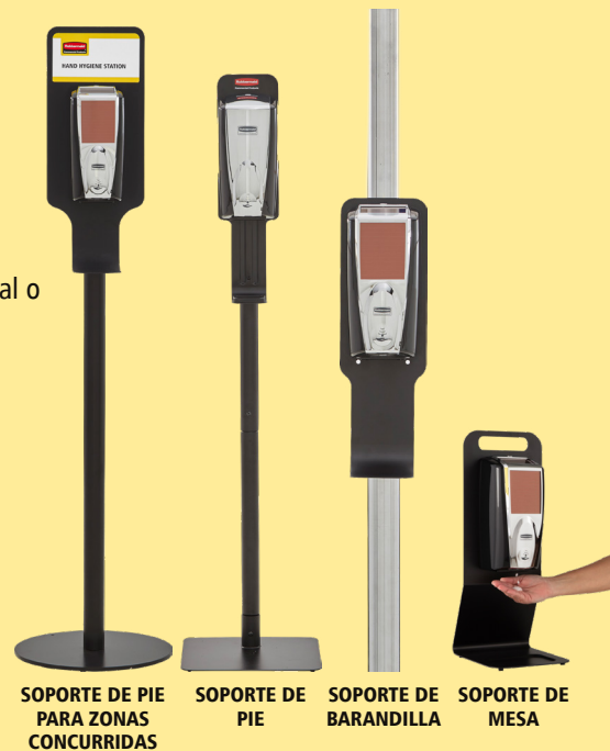
SOPORTE DE PIE PARA ZONAS CONCURRIDAS

Una dosis contiene 0,4 ml, por lo que cada recambio de 1100 ml proporciona hasta 2750 dosis.